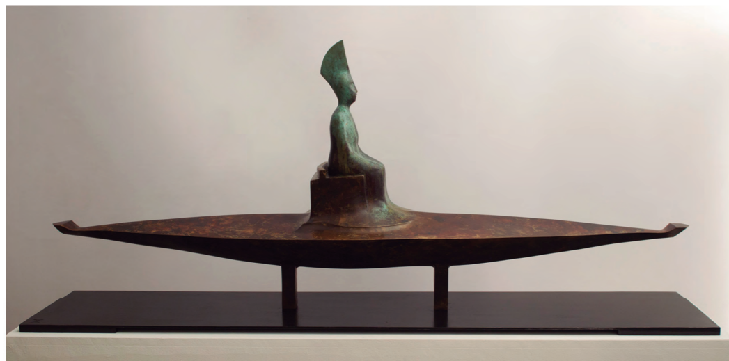
ÍTACA II. Bronze, 56 x 130 x 28 cm