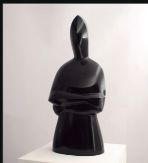
Portada: MIRALL DE LLUNA Marbre negre de Bèlgica 50 x 25 x 16 cm

"El seu bagatge artístic i les seues influències, unides a una magistral tècnica i sublim resolució compositiva, situen l'artista Antoni Miquel Morro en una posició, en l'àmbit artístic contemporani, difícilment superable i les seues obres representen, amb tota certesa, la plenitud de la forma en l'escultura." (Mar Beltrán Alandete, Universitat de València).